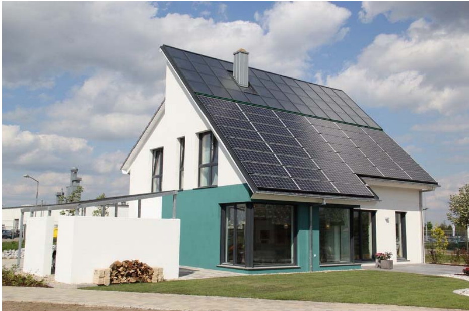
➤ Abb. 3: Erstes bezahlbares energieautarkes Eigenheim Europas als unbewohntes Musterhaus in Lehrte/Hannover von der HELMA Eigenheimbau AG Baujahr 2011. Es versorgt sich selbst durch Solarthermie + Langzeitwärmespeicher und Photovoltaik + Akku sowie etwas Biomasse mit Wärme, Strom und E-Mobilität. Primärenergiebedarf: 7 kWh/m 2 a.