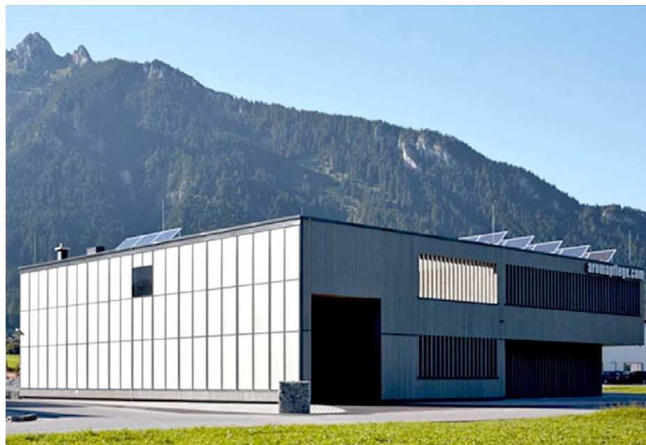
➤ Abb. 12: Gewerbeobjekt in Österreich. Aromacampus Baujahr 2016. In Lechaschau Österreich Bj. 2016 mit 770 m 2 Nutzfläche, Niedrigstenergiestandard Hz rund 28.000 kWh/a, rund 30 kWh/m 2 a, Solarthermiefassade 140 m 2 mit 25 m 3 Langzeitwärmespeicher, Photovoltaik 24 kWp mit 40 kWh Akku Lilo, Restenergiebedarf wird gedeckt mit Rapsöl BHKW, Solare Deckung Wärme ca. 76 %, Solare Deckung Strom ca. 80 %