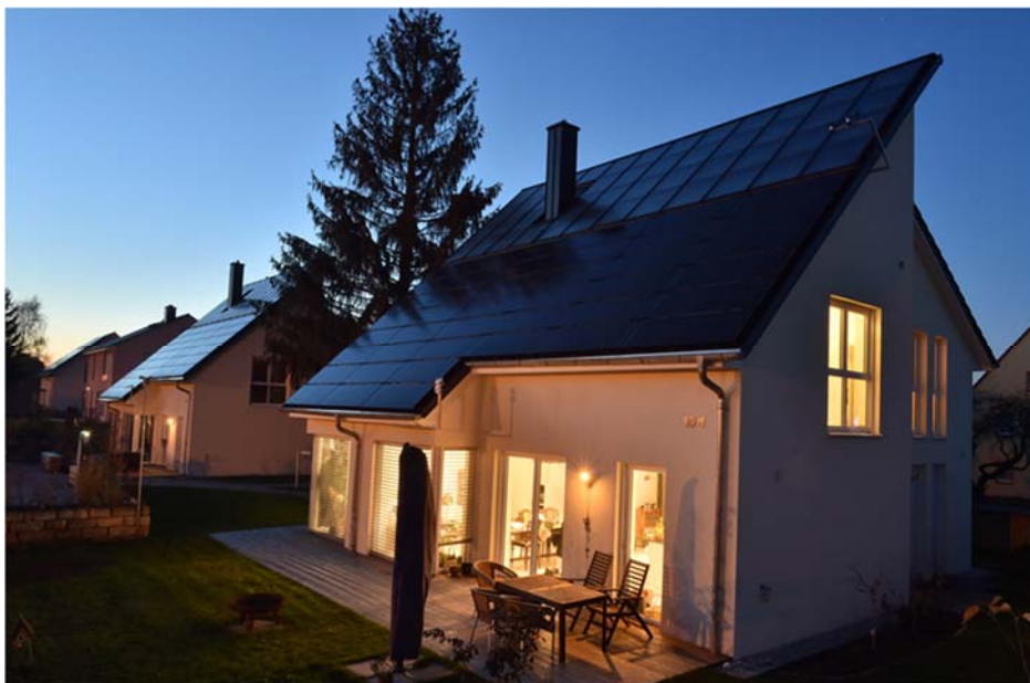
➤ Abb. 4: Intelligente Eigenversorgung mit Wärme, Strom und Mobilität aus der Sonne. Das Haus wird zur Tankstelle. Es hat eine Wohnfläche von 161 m 2 , Solarthermie 46 m 2 mit 9 m 3 Langzeitwärmespeicher, 8,4 KWP Photovoltaik mit 58 kWh Akku. Die ersten beiden bewohnten energieautarken Einfamilienhäuser Europas in Freiberg/Sachsen wurden 2013 errichtet von der HELMA Eigenheimbau AG. Drei Jahre lang wurden diese beiden Häuser durch die TU Bergakademie Freiberg messtechnisch untersucht. Primärenergiebedarf: 7 kWh/m 2 a, Stromverbrauch 2.100 kWh/a, Holzbedarf 2-3 rm/a. Solare Deckung Strom 98 %, Wärme 70 %, E Mobilität 85 %.