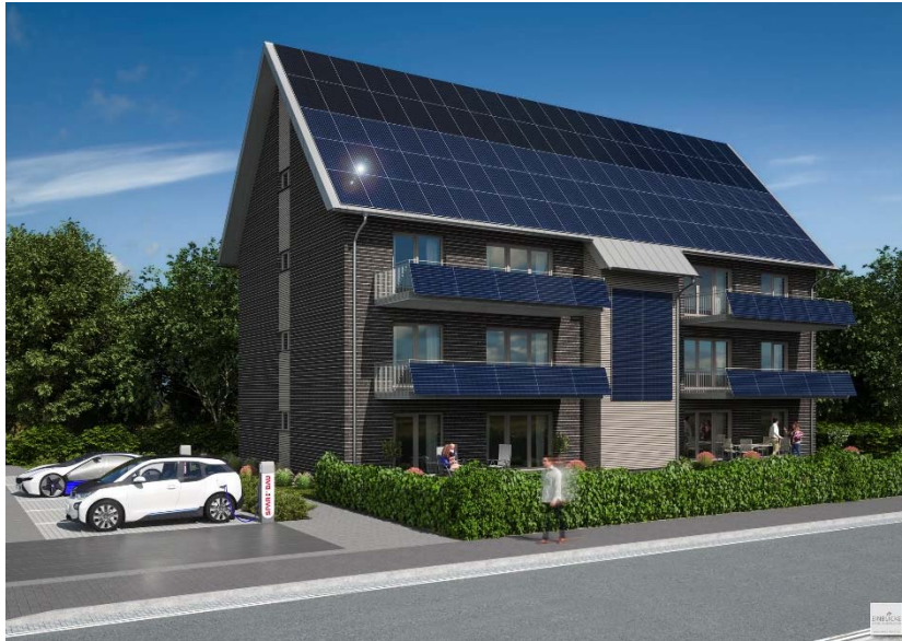
➤ Abb. 9: Miete mit Energieflat: Energieautarkes Mehrfamilienhaus mit 6 Wohneinheiten in Wilhelmshaven, Baubeginn geplant 2017. 96 m 2 Solarthermie mit 19 m 3 Langzeitwärmespeicher sowie 28 KWP Photovoltaik auf dem Dach und an den Balkonen mit 54 kWh Akku erreichen rund 70 % solare Deckung bei Strom und Wärme. Der Vermieter kann dem Mieter für mehrere Jahre eine Pauschalmitte anbieten, in der Wohnen, Wärme, Strom und E-Mobilität als flatrate bereits enthalten ist.