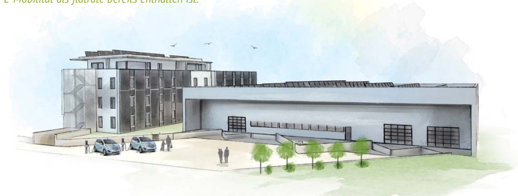
➤ Abb. 10: Energieautarkes Gewerbeobjekt mit Lagerhalle bei Freiburg. Baubeginn 2018