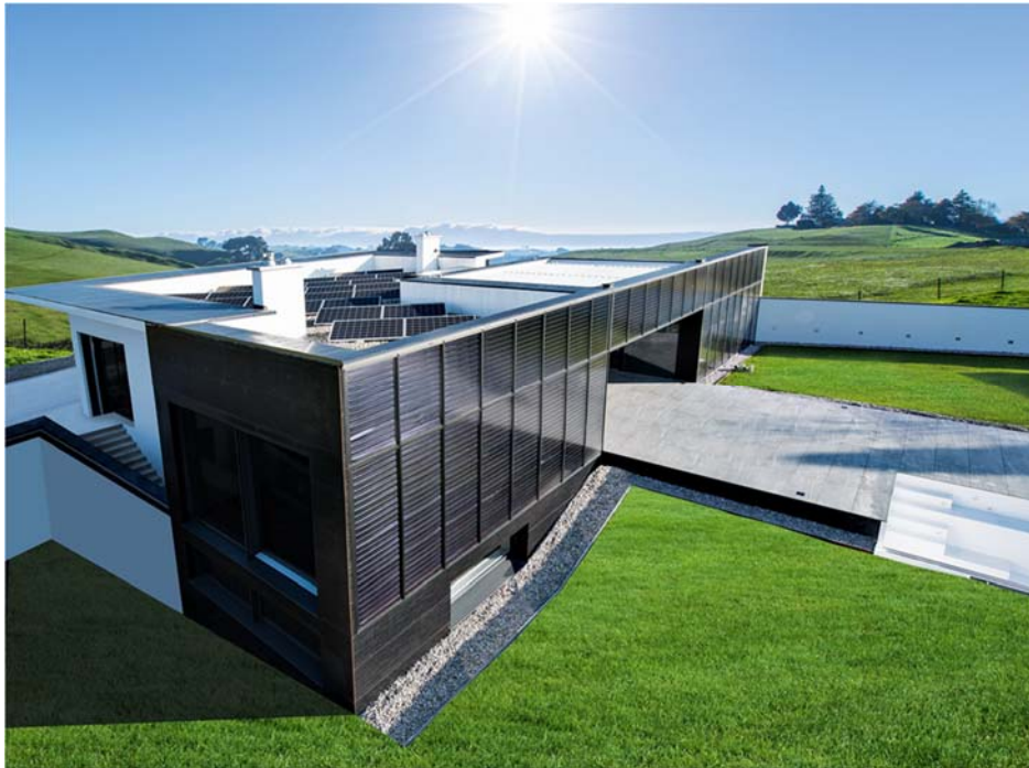
↗ Abb. 5: VitalSonnenhausPro der Firma Bauhütte Leitl-Werke GmbH: Das erste energieautarke Gebäudes Österreichs, Baujahr 2016 in Schwertberg/Österreich. Es ist barrierefrei und hat 141 m 2 Wohnfläche. Wärme, Strom und Mobilität kommen von der Sonne. Zum Einsatz kommen 64 m 2 Solarthermie mit 6 m 3 Langzeitwärmespeicher, 6 kW p Photovoltaik und 19 kWh Akku sowie Pelletkessel mit Stirlingmotor.