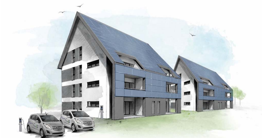
➤ Abb. 11: Miete mit Energieflat: Zwei energieautarke Mehrfamilienhäuser mit je 7 Wohneinheiten in Cottbus, Baubeginn 2017. 100 m 2 Solarthermie mit 25 m 3 Langzeitwärmespeicher sowie 30 KWP Photovoltaik auf dem Dach und an den Balkonen mit 54 kWh Akku erreichen zwischen 65 und 77 solare Deckung bei Strom und Wärme. Der Vermieter kann dem Mieter für mehrere Jahre eine Pauschalmitte anbieten, in der Wohnen, Wärme, Strom und E-Mobilität als flatrate bereits enthalten ist.