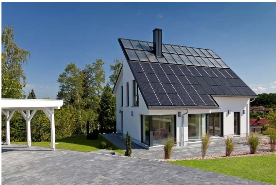
↗ Abb. 6: Als erste Bank Deutschlands baut die VR-Bank Altenburger Land eG 2016 in Schmölln ein vernetztes energieautarkes Haus. Es soll eine neue Art der Altersvorsorge demonstrieren: die Investition in steuerfreie Einsparungen (Kosten für Wohnen, Wärme, Strom und E Mobilität entfallen im Alter nach Abzahlung des Hauses), Bildquelle: VR-Bank Altenburger Land eG