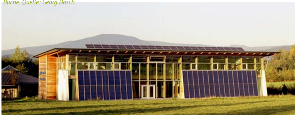
➤ Abb. 8: Besucherzentrum im Bayerischen Wald, Baujahr 2001 mit einer Nutzfläche von 763 m 2 und einem Primärenergiebedarf von 7,5 kWh/m 2 a. Auch dieses gewerblich genutzte Gebäude beheizt sich seit 2001 mittels Solarthermie und Langzeitwärmespeicherung ganzjährig zu 100% nur mit der Sonne. Außerdem erzeugt es noch Solarstrom, hauptsächlich zur Eigennutzung. Es ist über ein kleines Nahwärmenetz mit den Nachbarhäusern verbunden und gibt vom Frühjahr bis Herbst Wärme ab.