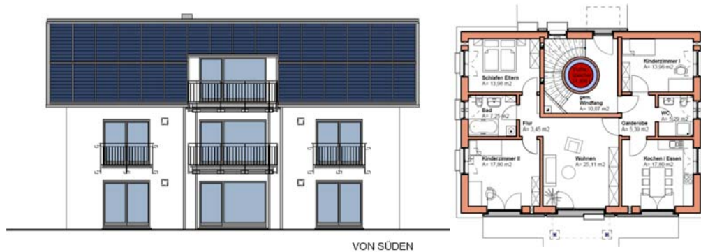
➤ Abb. 7: Dreifamilienhaus in München gebaut 2011 als Sonnenhaus mit einer Wohnfläche von 280 m 2 , Kollektorfläche 67,5 m 2 , Langzeitwärmespeicher 15 m 3 im Treppenhaus. Spezifischer Primärenergieverbrauch 8 kWh/m 2 a, solare Deckung 2012 gemessen 79%, Zusatzheizung Stückholz, Verbrauch 2011: 2 fm trockende Buche.